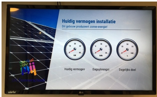
Huidige vermogen installatie

Afgelopen zomer zijn er op ons dak zonnepanelen geplaatst. Kort geleden is hiervoor een scherm geïnstalleerd waarin we kunnen zien hoeveel energie de zonnepanelen opleveren. Dit scherm zal ook gebruikt worden voor diverse lessen in het kader van Natuur en Techniek.